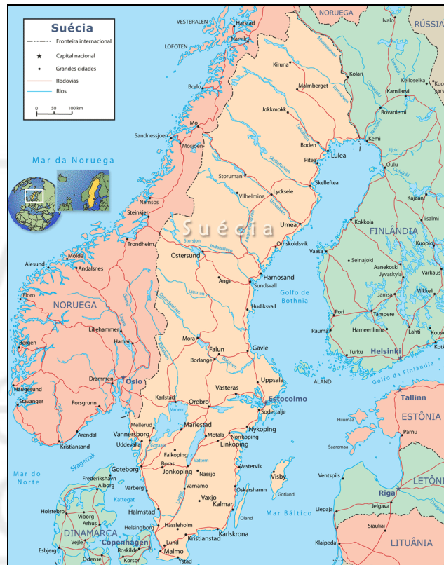
Gráfica 1: Mapa de Suecia

Suecia se encuentra localizada en el norte de Europa, en la parte oriental de la península Escandinava, tiene una superficie total de 449.964 km 2 . Limita al norte con Noruega y Finlandia; al sur con el mar Báltico; al este con Finlandia y el golfo de Botnia, y al oeste con el mar del Norte y Noruega.