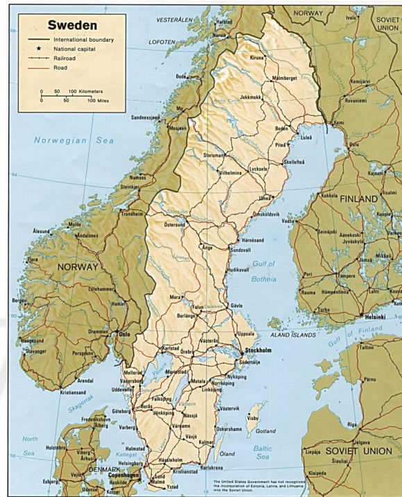
Gráfica 6: Mapa principales carreteras de Suecia