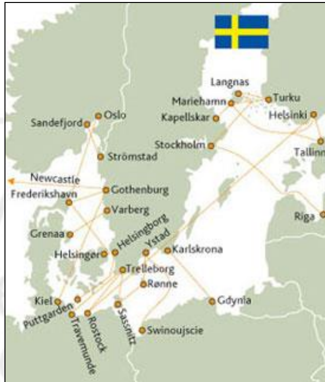
Gráfica 3: Red férrea de Suecia

El sistema férreo es uno de los sistemas más desarrollados en el país nórdico, permite una gran conectividad entre el centro del país y los países vecinos, cuenta con 11.633 km de rieles. De acuerdo con la empresa SJ AB, operador ferroviario estatal, cerca del 80% de la red está electrificada.